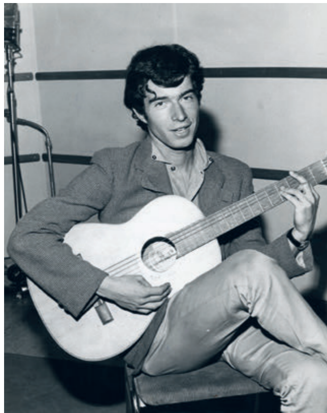
Nieuwe Oogst, 22 juli 1964, na de middag-repetitie voor zijn televisiedebuut.

De tekst is gewaagd, zo halverwege de jaren zestig. Van seks vóór het huwelijk en ongehuwde moeders moet de samenleving niets hebben, zeker de ouderen niet. Meisjes die ongewenst zwanger raken, doen er goed aan zo snel mogelijk te trouwen met de 'dader'. Anders ben je als jonge ouders de rest van je leven een schande voor de omgeving en je familie.