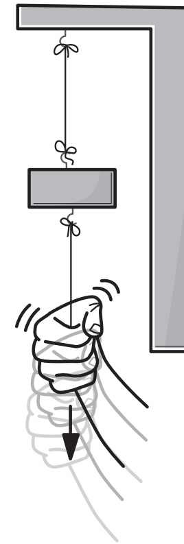
Figuur 1 Traagheid testen.

Je kunt het begrip ‘traagheid’ op een simpele manier thuis demonstreren. Hang een blokje of een ander voorwerp aan een touwtje, en hang hieraan een touwtje met dezelfde lengte en dikte; zie figuur 1. Voer nu twee experimenten uit. Trek eerst langzaam aan het onderste touwtje, en trek nadat je het touwtje weer netjes hebt vastgeknoopt vervolgens hard aan het touwtje. Als je het goed doet, dan knapt het bovenste touwtje als je langzaam aan het onderste touwtje trekt, maar knapt juist het onderste touwtje als je met een snelle ruk aan het onderste touwtje trekt.