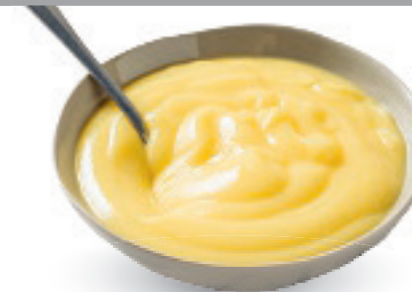
Het nationale toetje