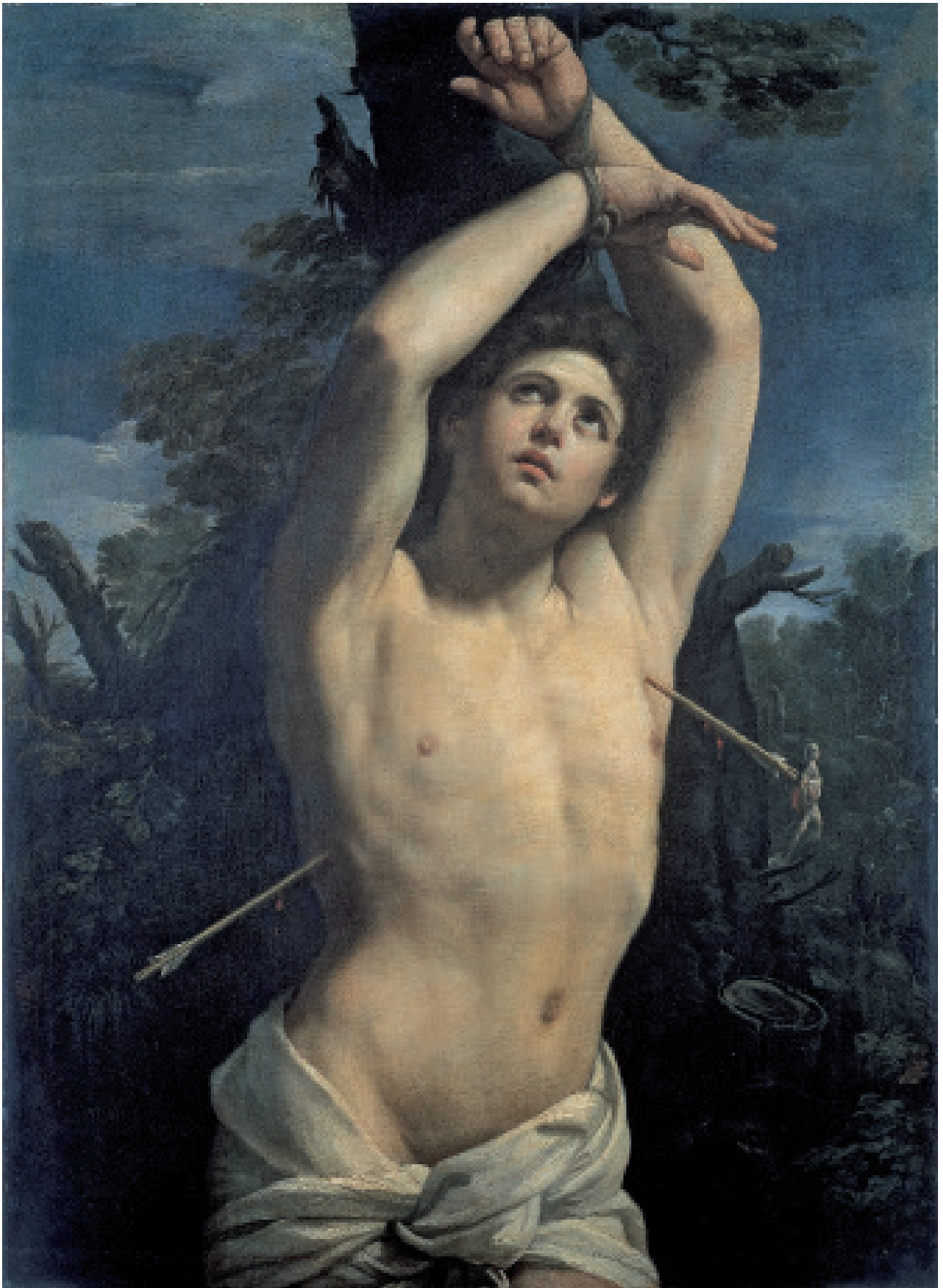
Guido Reni, Sint-Sebastiaan , ca. 1615