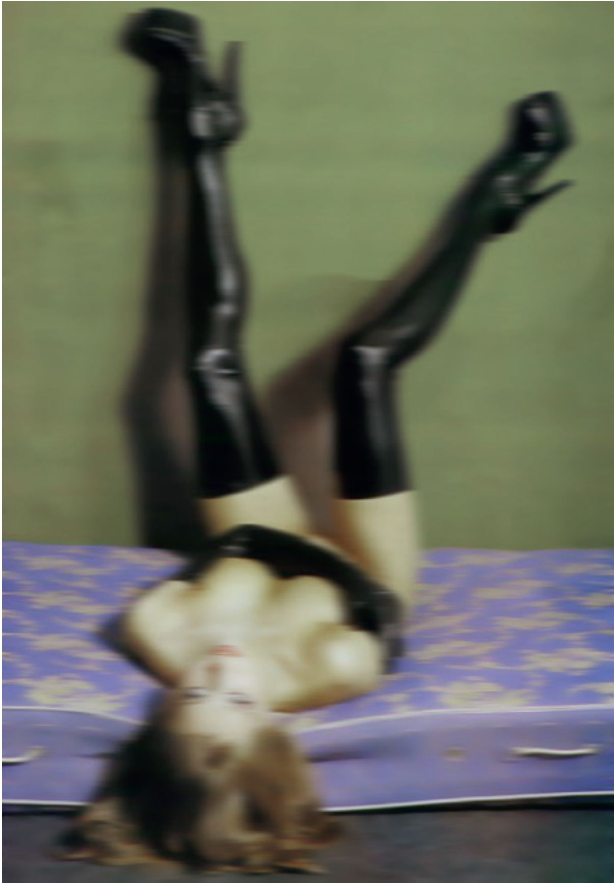
Thomas Ruff, Nudes ru 05 (Nud 053) , 2000