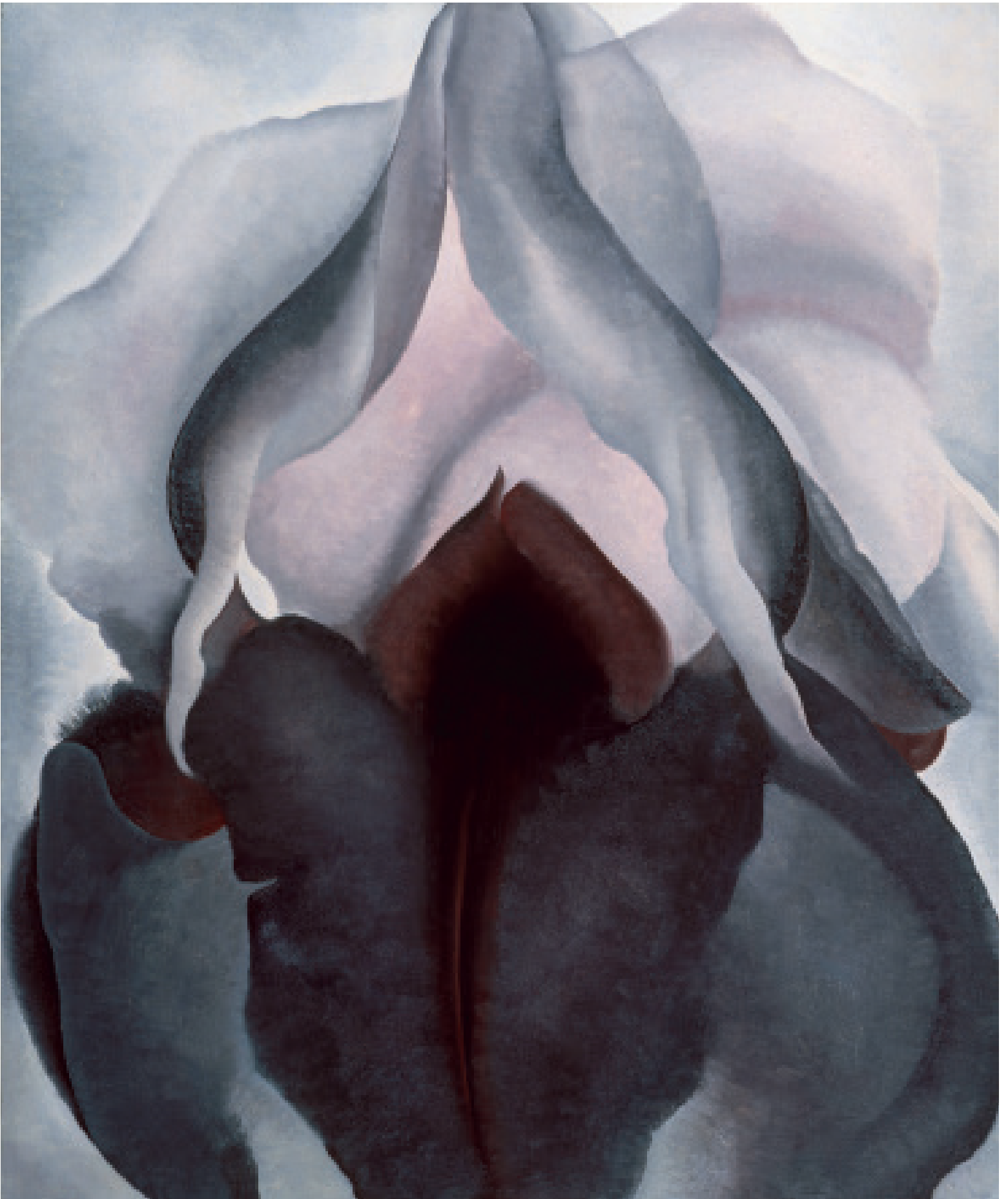
Georgia O'Keeffe, Zwarte iris , 1926