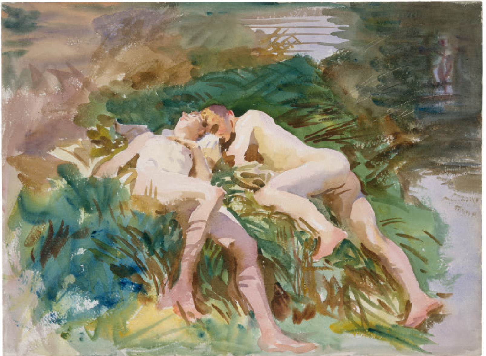
John Singer Sargent, Badende tommies , 1918