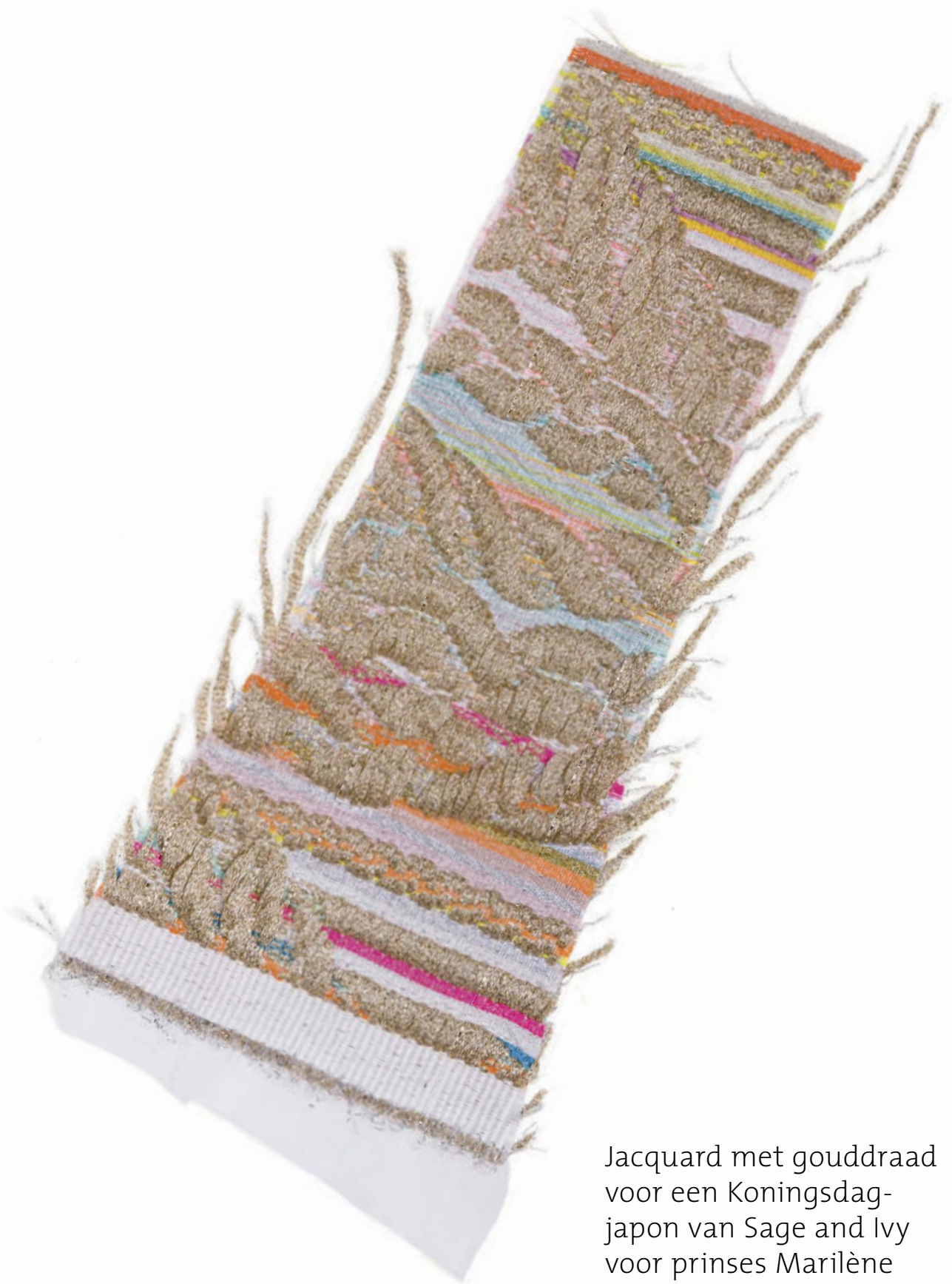
Jacquard met gouddraad voor een Koningsdag- japon van Sage and Ivy voor prinses Marilène