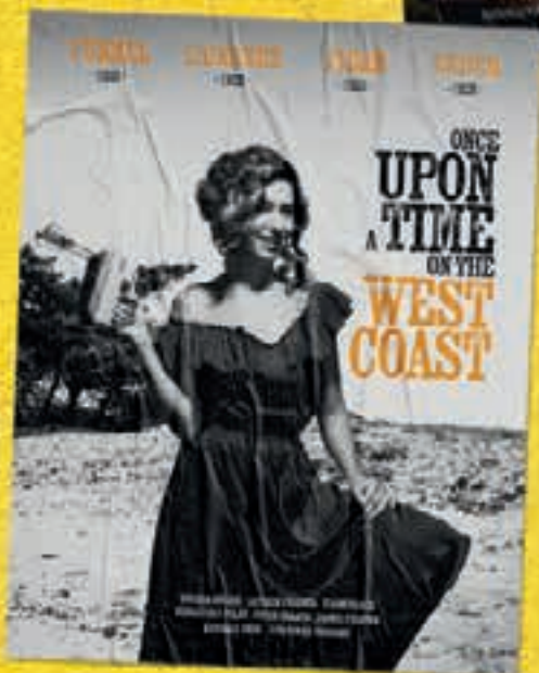
92 ONCE UPON A TIME ON THE WEST COAST