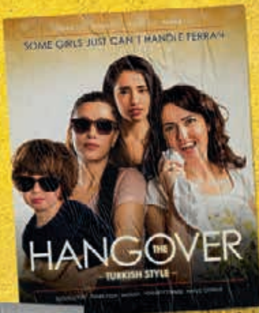
118 THE HANGOVER TURKISH STYLE